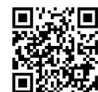
救急車利用マニュアル