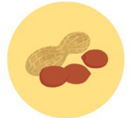
らっかせい (ピーナッツ)