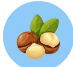
マカダミアナッツ